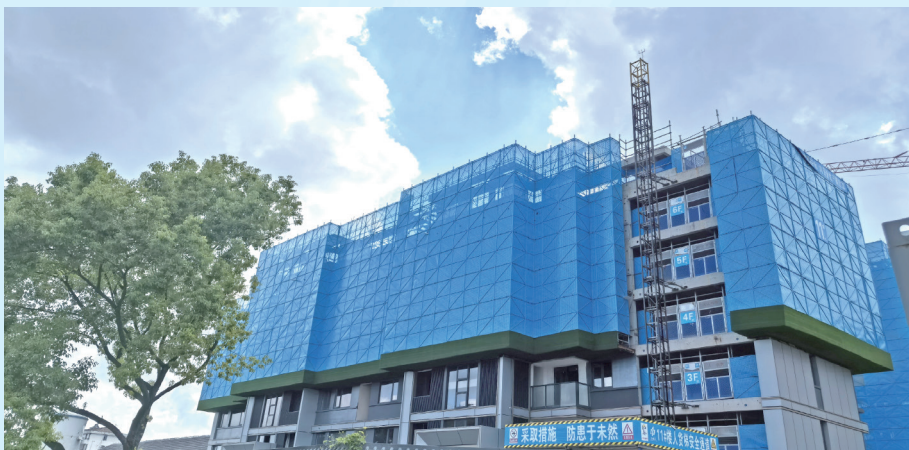
外脚手架，卸料平台采用定型化防护措施