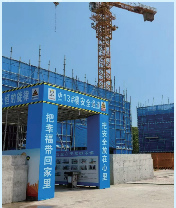
安全通道坚固畅通